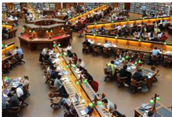
Imagen 1. Biblioteca Photro De ángulo Alto (CCO)

Reconocer las diferentes plataformas tecnológicas y redes de innovación del SENA, que le permita conocer los beneficios y las bondades que estas brindan dentro de su proceso formativo.